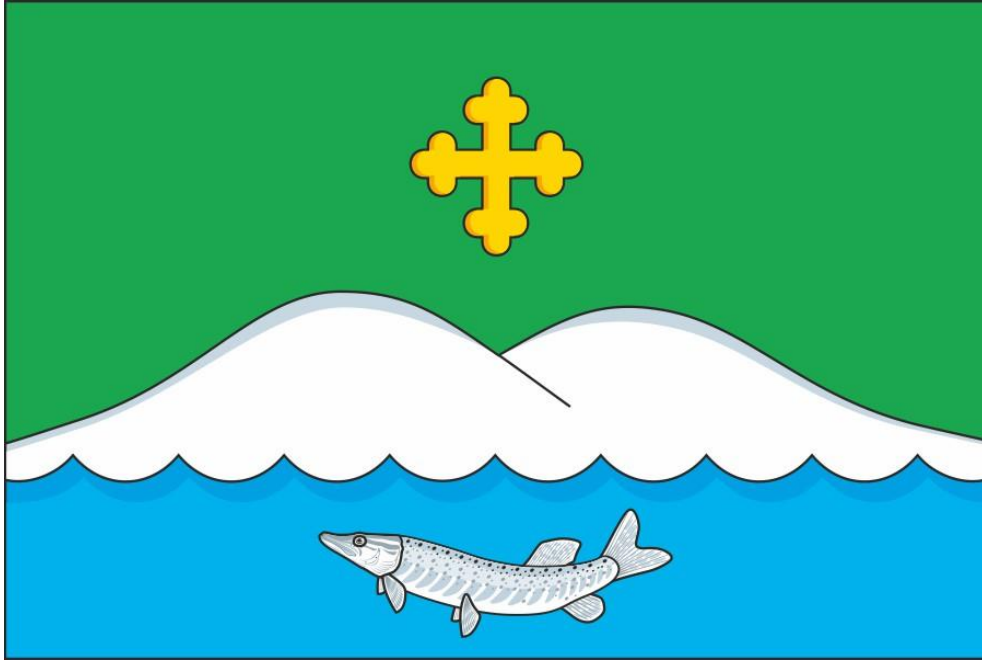
Флаг Белозерского муниципального округа (цветное изображение)